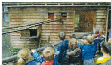
Visite de la réserve de CALVIAC