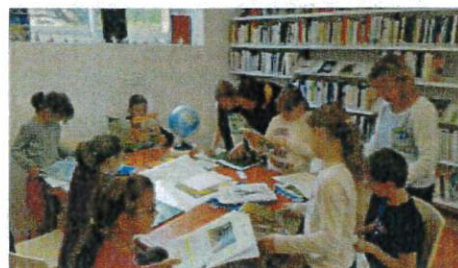
Recherches sur les espèces à la médiathèque de SAINTE NATHALENE