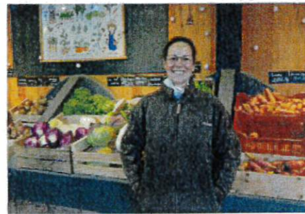
Les jardins de MALEVERGNE: Légumes et œufs BIO Vente sur place