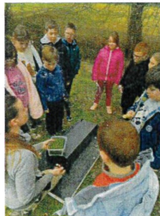
Pose d'un radeau à empreintes sur l'énéa avec la réserve de CALVIAC