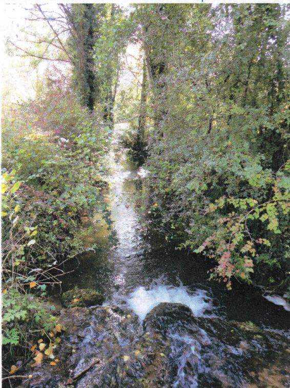
L'Enéa au pont de rivière à St Vincent