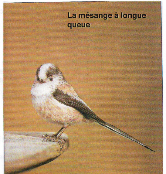
La mésange à longue queue