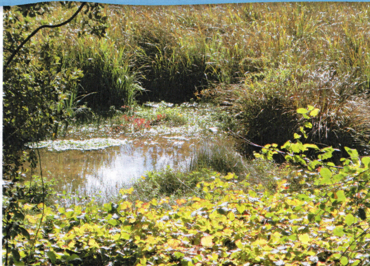
Zone humide en aval du moulin de la jamme

L'HEURE DU CONTE- contes pour tous, a eu lieu le 20 octobre sur le thème de l'eau.