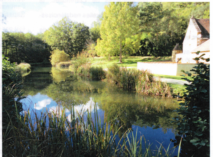
Le Moulin de la Borie