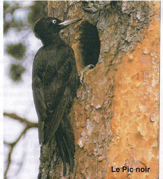
Le Pic noir

Tel : 06 09 76 76 37 Monica Dubost Tel : 05 53 59 15 36 Brigitte Audouard Tel : 06 32 83 89 64 Francis Paponie