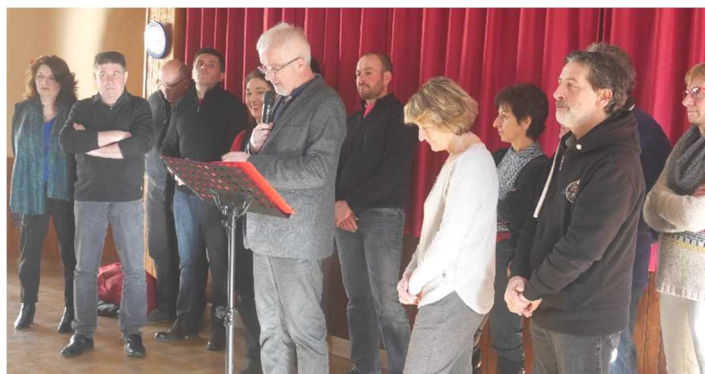
Présentation des vœux le samedi 14 janvier 2017